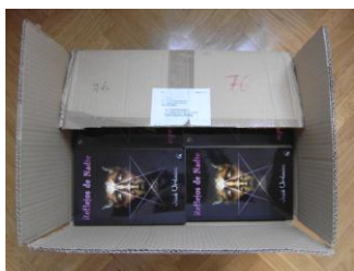
En esta caja hay 76 libros